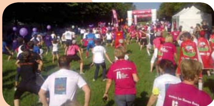
L'échauffement avant la course