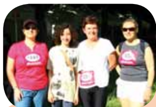
Une partie de l'équipe IRIS

PS : nous recherchons des participants pour le marathon de Paris le 15 avril, Peut-être y-a-t-il des marathonniens parmi vous !